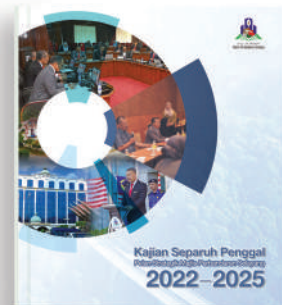
Buku Kajian Semula Pelan Strategik MPS 2022-2025