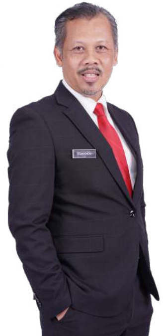
(DATU' MOHD YAZID B. SAIRI D.S.I.S )

Akhir bicara dengan berbekalkan semangat dan azam tahun baharu 2023, saya menyeru seluruh warga MPS untuk mempertingkatkan usaha, disiplin, keazaman, inovasi, kreativiti dan integriti agar kita dapat memastikan mutu perkhidmatan MPS akan terus dipertingkat ke aras yang lebih cemerlang.