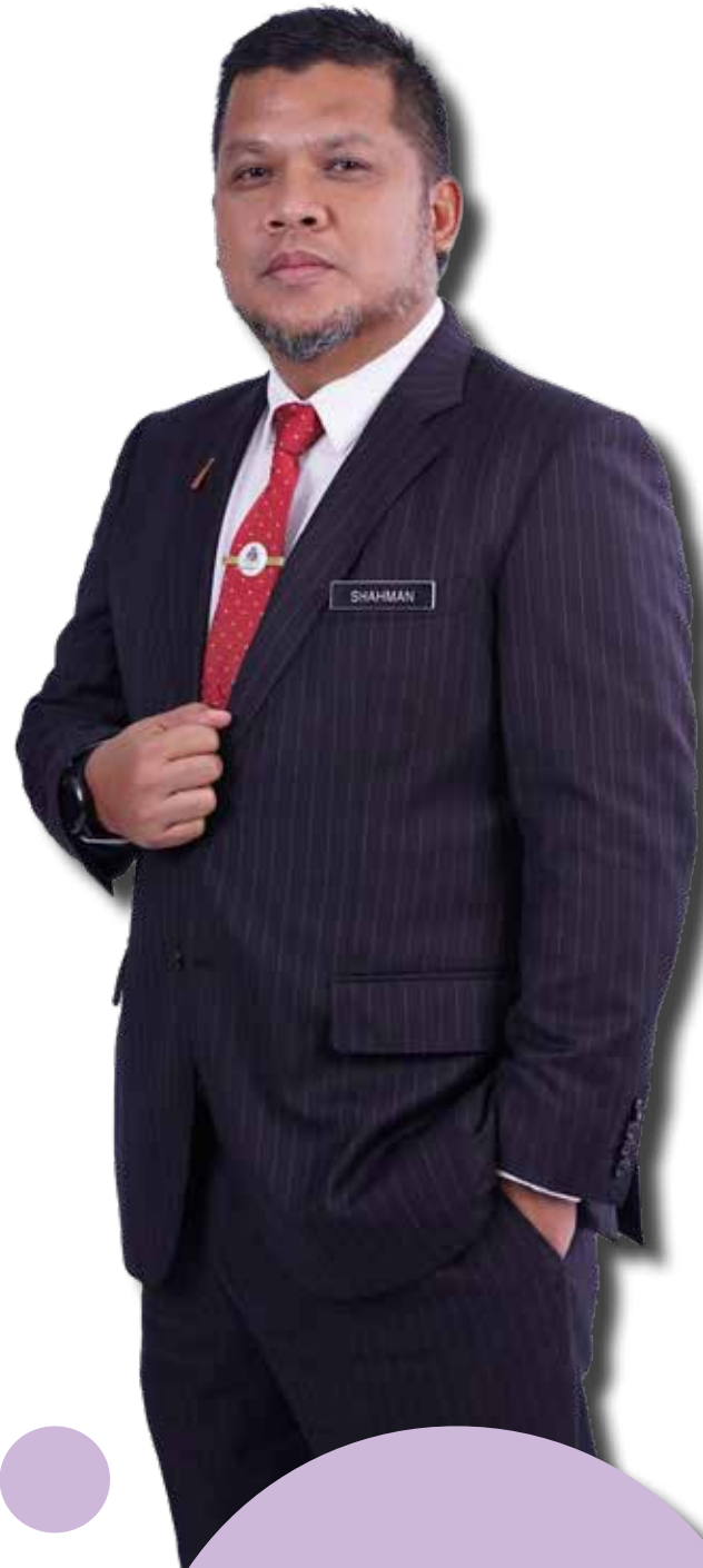
TUAN SHAHMAN BIN JALALUDIN Yang Dipertua Majlis Perbandaran Selayang

Pingat/Bintang ke14 : Bintang Kesatria Setia Diraja (K.S.D) pada 2 Jun 2012 - YDPA